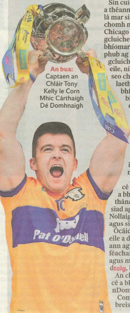
An bua: Captaen an Chláir Tony Kelly le Corn Mhic Cárthaigh Dé Domhnaigh

Dáta an fhoilsithe: Dé Céadaoin, 24 Iúil 2024.